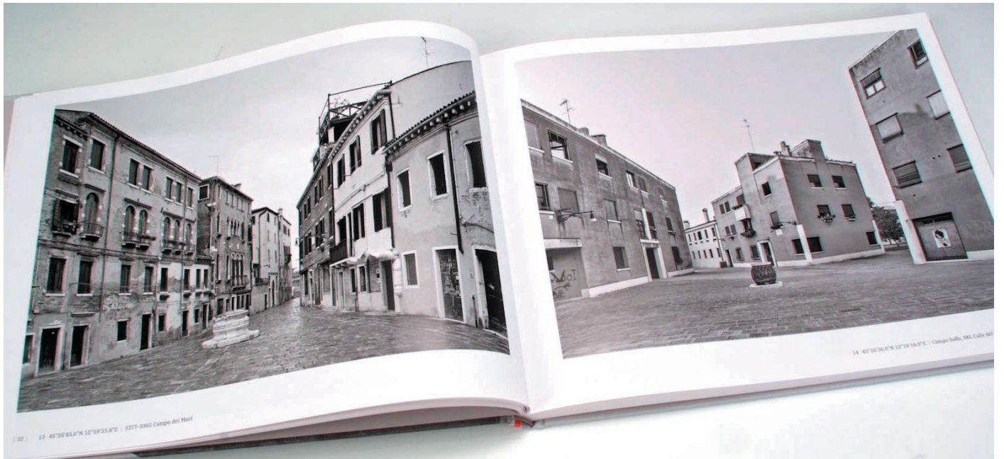
13 - 45°28'43.47"N 12°19'53.8"E - 3377-3385 Campo dei Morti