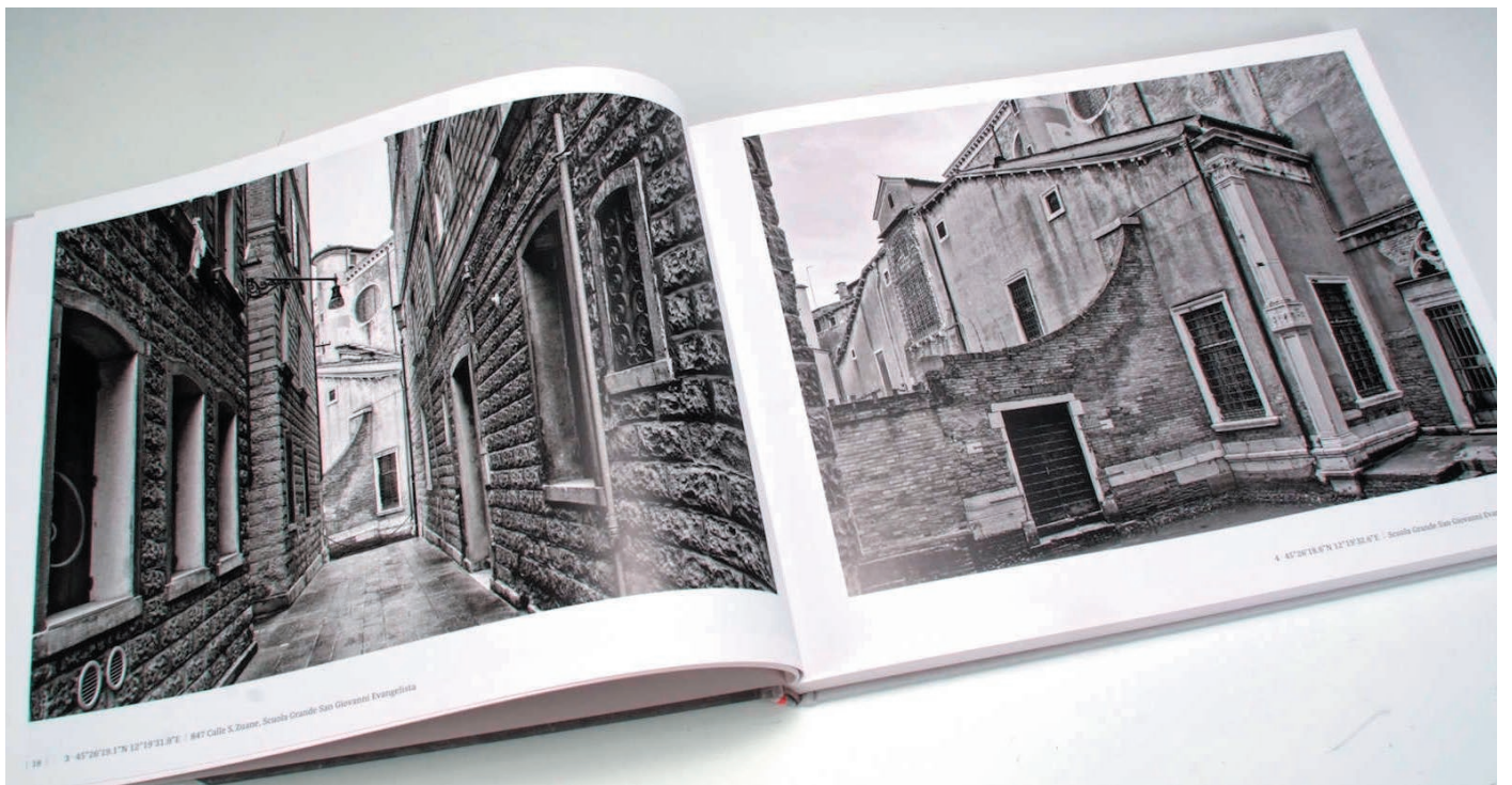
15 - 45°28'20.17"N 12°19'31.8"E - 847 Calle S. Zuanne, Scuola Grande San Giovanni Evangelista